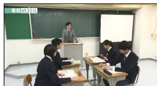
<授業展開例動画イメージ>