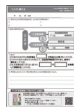
生徒用ワークシート