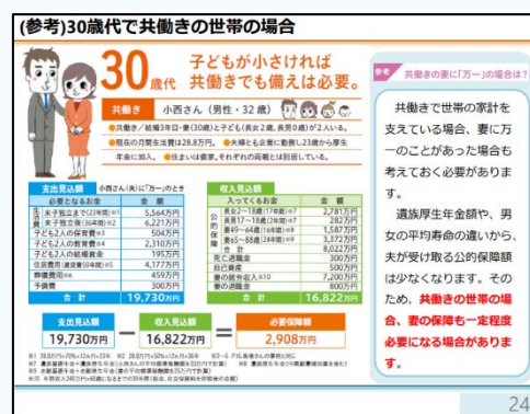
【データ①】(参考)30歳代で共働きの世帯の場合