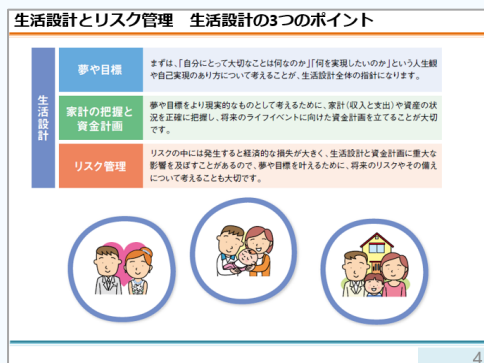
【データ①】生活設計とリスク管理 生活設計の3つのポイント