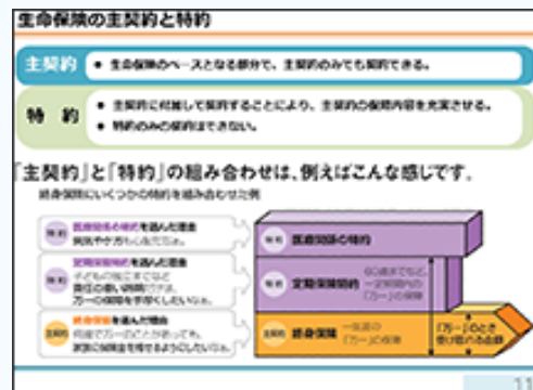
【データ②】生命保険の主契約と特約