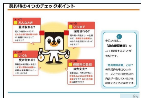
【データ④】契約時の4つのチェックポイント